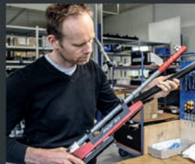
Christian Planer Rifle Fitting/Service, Reparaturen